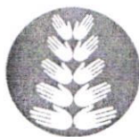
TABLA DE SIGLAS Y ACRÓNIMOS

Para una mejor comprensión de esta Recomendación, el significado de las siglas y los acrónimos utilizados son los siguientes: